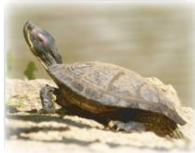
Tortue à tempes rouges dite "de Floride" (Trachemys scripta) Espèce exotique envahissante...

Carapace à l'aspect lisse Peau (tête, cou, pattes) ponctuée de jaune