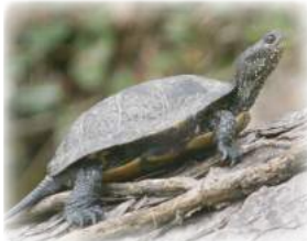
Cistude d'Europe (Emys orbicularis) Espèce protégée

Carapace à l'aspect lisse Peau (tête, cou, pattes) ponctuée de jaune